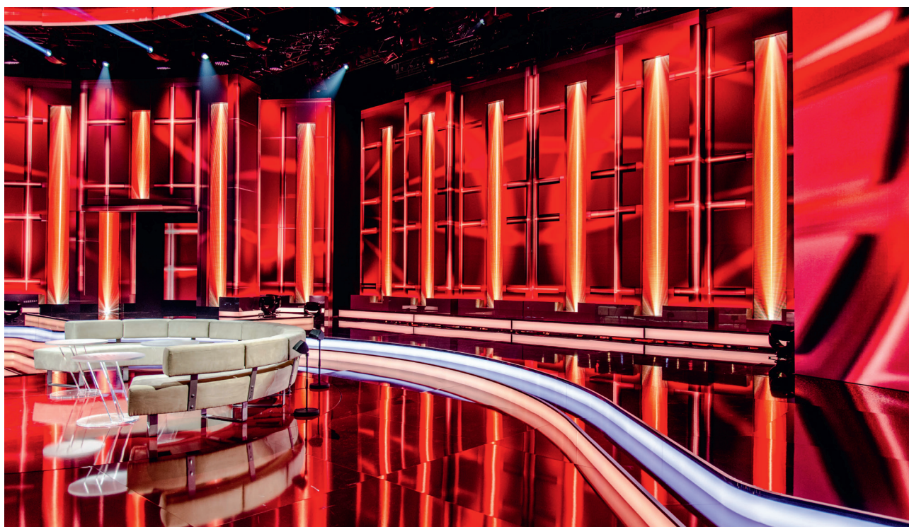
Ein Teil der Kulisse von ‚Verstehen Sie Spaß‘ - diese umweltgerechte Produktion wurde bereits zwei Mal mit dem „Grünen Drehpass“ der Filmförderung Hamburg Schleswig-Holstein ausgezeichnet. Geprüft wird dabei die Umsetzung zahlreicher ökologischer Maßnahmen im Sinne von Nachhaltigkeit und Umweltfreundlichkeit.

Bereits zum zweiten Mal zeichnete die Filmförderung Hamburg Schleswig-Holstein Bavaria Film mit dem „Grünen Drehpass“ aus - für die umweltfreundliche Studioproduktion von ‚Verstehen Sie Spaß‘.