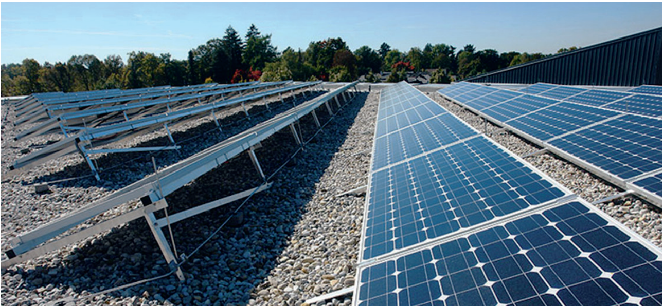
Bis zu 86.000 Kilowattstunden Solarstrom jährlich produziert Bavaria Film mit den Photovoltaikanlagen auf den Dächern seiner Neubauten.