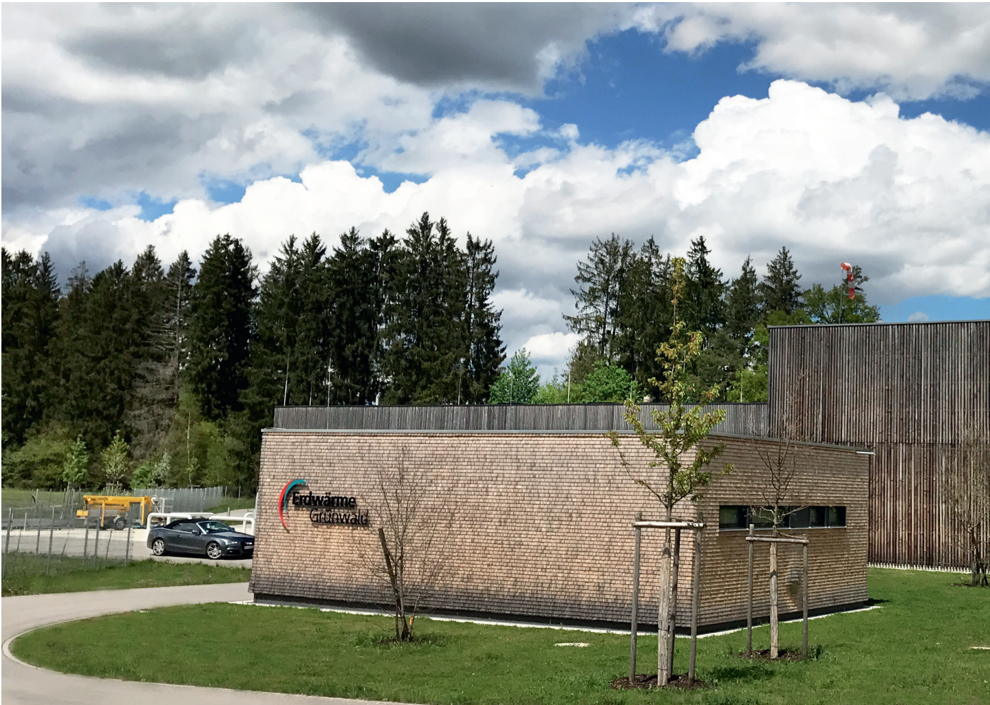
Die EWG-Geothermieanlagen in Laufzorn: v.r. Heizkraftwerk, im Vordergrund der Infopavillon, im Hintergrund das ORC-Stromkraftwerk, und links - gerade noch sichtbar - die Bohrungen.

E s war der 8. Oktober 2008, als Grünwald entschied, ins Energiewende-Zeitalter einzutreten. Mit diesem Tag sicherte sich die Gemeinde Grünwald den Geothermie-Claim in Laufzorn, den das Oberhachinger Unternehmen Astherm GmbH vorentwickelt hatte. Damit gingen auch das Recht zur Bohrung, das Eigentum am Grundstück in Laufzorn und der Bohrvertrag auf die Gemeinde Grünwald über. Und klar war ab dem Tag auch der Name des neuen Grünwalder Energieversorgungsunternehmens: Erdwärme Grünwald GmbH, eine 100%ige Tochtergesellschaft der Gemeinde Grünwald, kurz EWG genannt.